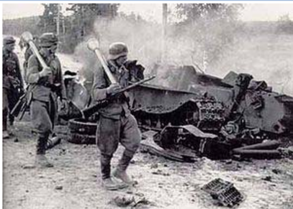
Finska soldater marscherar bredvid en förstörd sovjetisk T-34-stridsvagn.